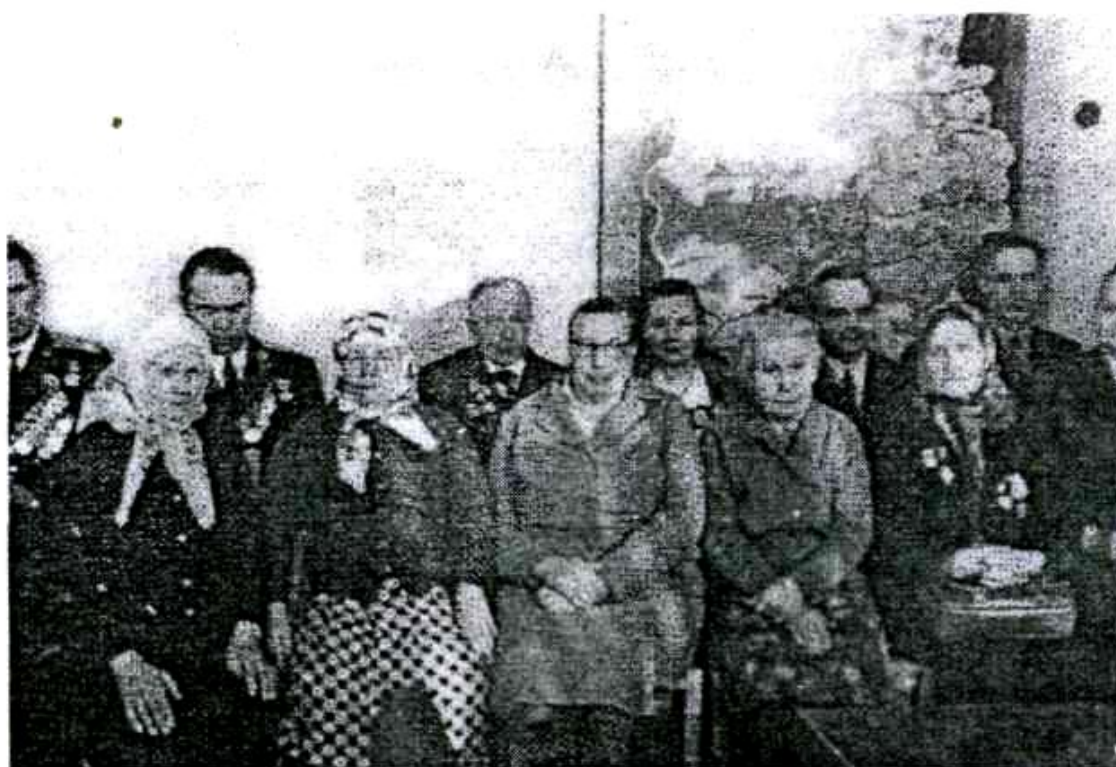
Встреча ветеранов Великой Отечественной войны. 1980-е г.