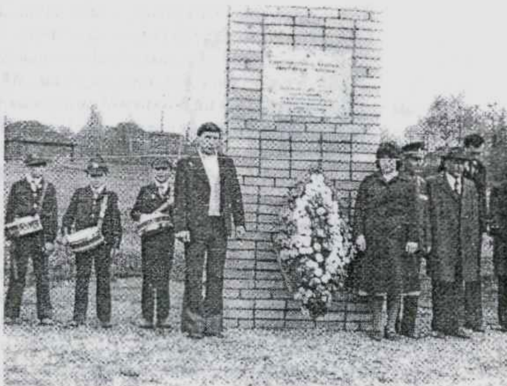
В память о подпольном госпитале в д. Якшино установлен обелиск.